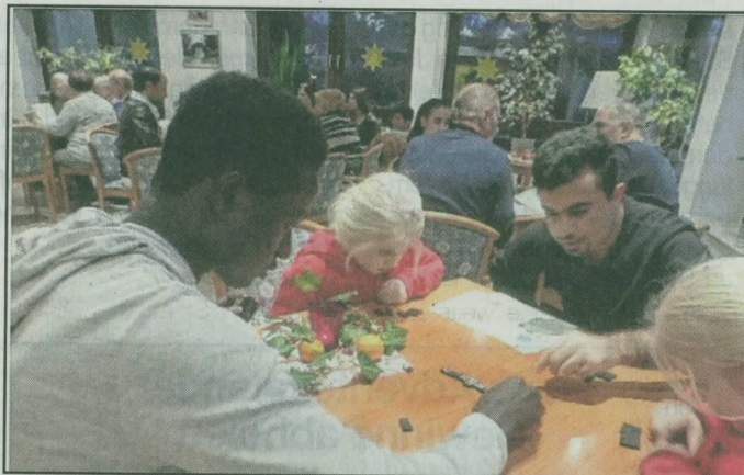
Groß und Klein spielten konzentriert und mit viel Spaß zusammen.

bauten mit Lego-Bausteinen. Dank der mitgebrachten Leckereien war auch für das leibliche Wohl aller gesorgt. „Der Spielenachmittag, verbunden mit der weihnachtlichen Feier, wird gut angenommen“, sagte die Vorsitzende des Willkommens-Teams, Su-