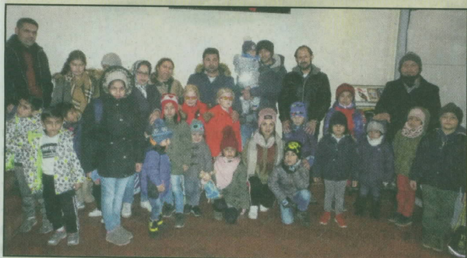
Weihnachtskino für die Flüchtlinge aus Ellerau und Quickborn.

Willkommensteam-Ellerau lud Flüchtlinge aus Ellerau und Quickborn zum Weihnachtskino ein